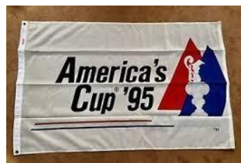
予告信号 アメリカズカップ95旗

規則3には、「レースに参加するか、またはレースを続けるかについての決定責任はその艇のみにある。」と規定されています。大会に参加することによって、それぞれの競技者は、セーリングには内在するリスクがあり、潜在的な危険を伴う行動であることに合意し、認めることとなります。これらのリスクには、強風、荒れた海、天候の突然の変化、機器の故障、艇の操船の誤り、他艇の未熟な操船術、バランスの悪い不安定な足場、疲労による傷害のリスクの増大などがあります。セーリングスポーツに固有なのは、溺死、心的外傷、低体温症、その他の原因による一生消えない重篤な傷害、死亡のリスクです。